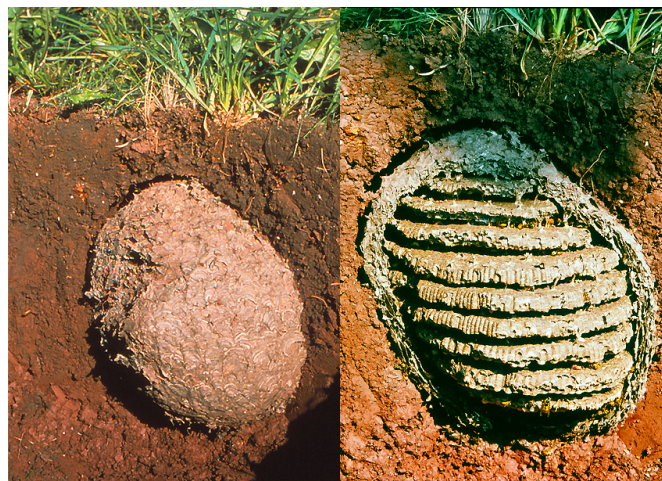
Exempel på ett jordgetingbo. Till höger syns de olika våningarna i boet.