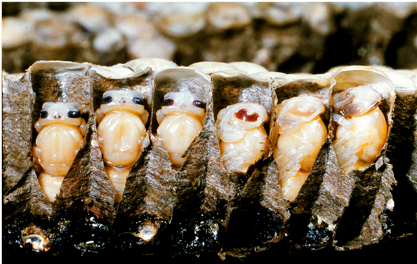
Inuti cellerna ligger de förpuppade och alienliknande larverna och förvandlas långsamt till riktiga getingar.

för nära dess bo, eller om den känner sig trängd och hotad.