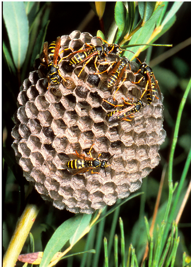
Getingar bygger sina bon av söndertuggat trä som blandas med saliv.