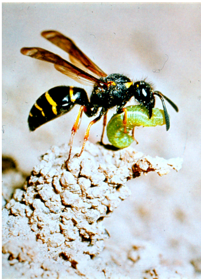
En ensamlevande - solitär - geting sitter på ingången till sitt bo med en larv, som den fångat.

D et finns också solitära getingar. Det är getingar som lever ensamma och inte bildar samhällen. Sådana getingar bygger ett flertal små bon på flera olika platser. Varje bo består av en eller ett par celler, där getingen lägger ägg, samt stoppar in larver, flugor och annat näringsrikt, som getinglarven kan leva på.