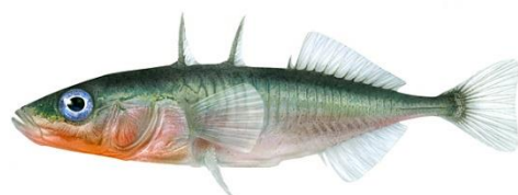
Storspigg, hane i lekdräkt.