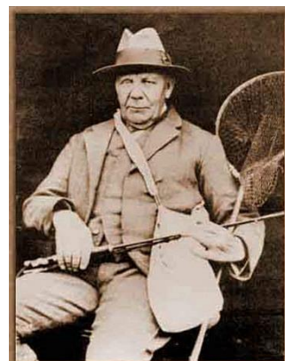
GEM. Skues färdig för en dust med Itchens öringar.

George Edward MacKenzie Skues avled 9 augusti 1949, i sitt hem i London, endast några dagar innan han skulle fylla 91 år.