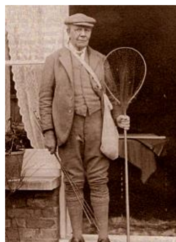
Skues klädd för flugfiske. (Creative Commons licens)

Skues förde noggranna anteckningar av sina nyfunna kunskaper och publicerade sina rön och tankar först i fiskepressen och sedan 1910 i sin första bok "Minor Tactics of the Chalk Stream", där han förde fram sina teorier och presenterade sin nymffiskemetod.