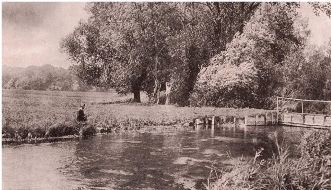
Parti av floden Itchen – en av Englands berömda kalkströmmar. Här utvecklade G.E.M. Skues sitt nymffiske, när fisken vägrade ta hans torrflugor.

B rittiske advokaten och författaren G.E.M. Skues tillhör den illustrerade skara som i böcker skildrat det fascinerande fisket efter öring i de engelska floder som kallas "kalkströmmar" ( chalk streams ). Skues har gått till historien som upphovsmannen bakom det moderna fisket med uppströms nymf och han skrev flera böcker i ämnet. I min bokhylla finns en av dessa böcker – den som vid nytrycket 1976 fick titeln "The Chalk Stream Angler", men som vid första utgivningen 1932 hade titeln "Side-lines, Side-lights & Reflections".