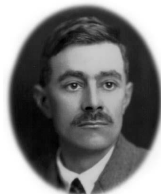
Porträtt av Henry Williamson, år 1933.

Henry (William) Williamson (1895, London – 1977, London) var en brittisk författare, som gjorde sig känd för sina natur- och socialhistoriska romaner. Han var mycket produktiv och publicerade mer än 50 böcker under sin livstid samt hundratals artiklar, noveller, etc. i tidningar och tidskrifter!