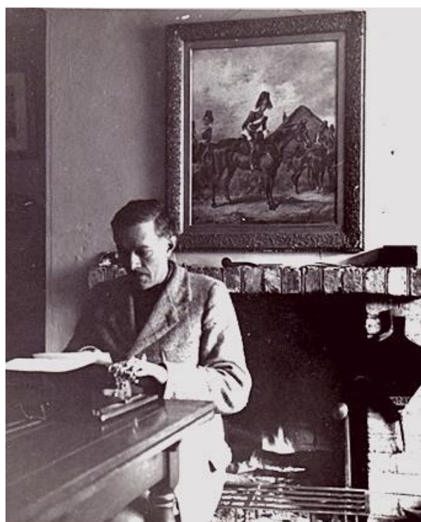
HW vid skrivmaskinen i stugan i Shallowford. I bakgrunden den stora öppna spisen, som ofta omnämns i boken.

N.B.: 1980 bildades The Henry Williamson Society i England och för den som vill veta mer om Henry Williamson, hans liv och författarskap så har sällskapet en hemsida som är sprängfylld med information, fakta och kuriosor. Hemsidan hittar man HÄR!