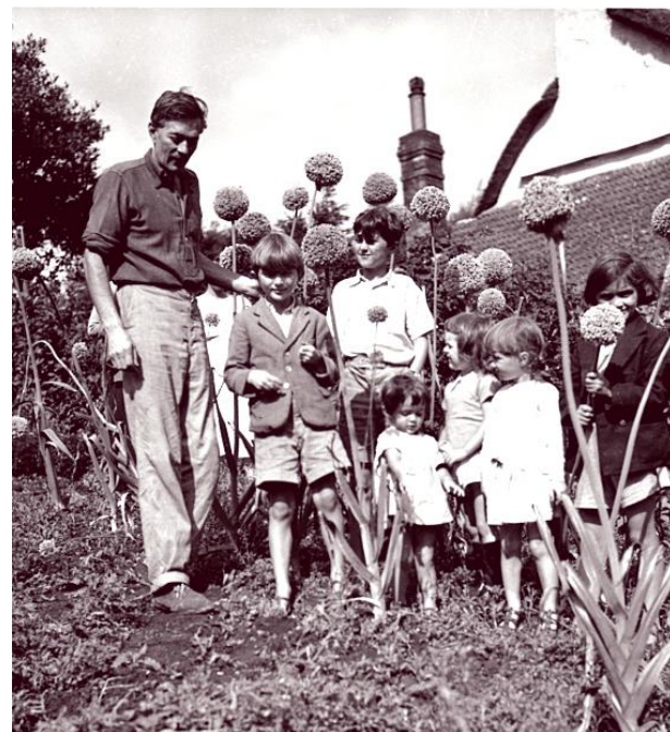
Tillsammans med sina egna och gästande barn inspekterar HW sin lökodling vid stugan i Shallowford.