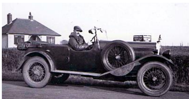
HW i sin Alvis Silver Eagle. Bilden från 1933.

I boken beskriver Williamson även längre eller kortare fiske- och naturutflykter som han och hans hustru gör i den nyinköpta öppna sportbilen ”Silverörnen” (En Alvis Silver Eagle av 1930 års modell!), bland annat till den avlägsna och vilda ögruppen Hebriderna utanför Skottlands västkust.