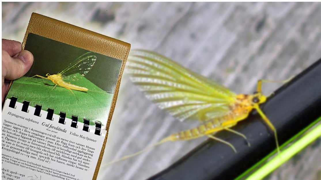
Med handboken "Dagsländor i öringvatten" fick vi flugfiskare en unik möjlighet att snabbt och enkelt artbestämna sländorna vid våra fiskevatten. (Bilden är ett montage.)

I slutet av 1970-talet publicerade tidskriften Svenskt Fiske en mycket uppmärksammad artikelserie som hette "Svenska flugan". Serien, som inleddes med dagsländor, var en unik inventering av svenska insekter av intresse för både fiskar och flugfiskare. Unikt var det också att de redovisade dagsländorna var försedda med svenska namn, som var arttypiska och som anspelade på kriterier som exempelvis sländornas livsmiljöer, färger, storlek, etc. Det var första gången våra dagsländor fått logiska svenska namn – ett välkommet komplement till deras vetenskapliga namn!