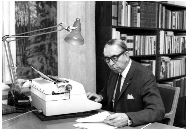
Författare, fiskare, jägare, vandringsman, konstkännare, hembygdsskildrare, miljökampe, naturvårdare, mm. mm. Hans Lidman hade många strängar på sin lyra.

Bibliografidelen listar också hans medverkan i andras böcker samt böcker och tidningar/tidskrifter som innehållit material om Hans Lidman, inklusive de skrifter, etc. om eller av Hans Lidman som Hans Lidman Sällskapet publicerat fram till bokens tryckning (2015). Ett litet men intressant kapitel handlar om opublicerat material av Hans Lidman, som återfanns i hans efterlämnade handlingar och arkiv.