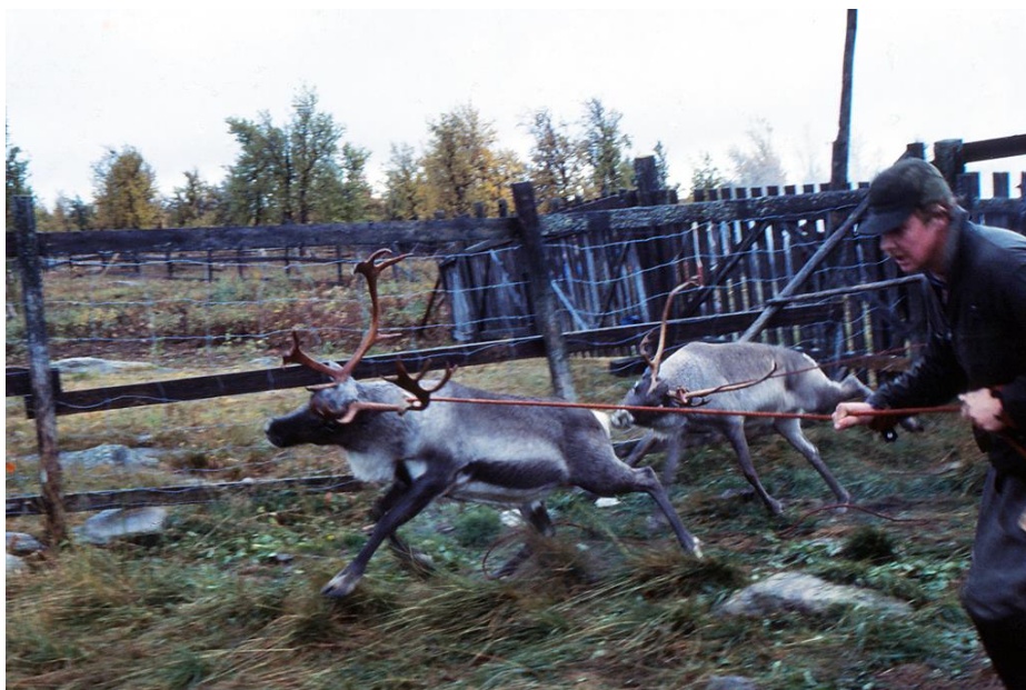
Det är en stressig morgon – det gäller att få in sarvarna i fällorna så snabbt som möjligt.

Vid höstslakten är det bara tjurar som fångas – de har då det bästa och mest eftertraktade köttet. Men det gäller att få ihop hjorden i rätt tid. Det är just de här dagarna i mitten av september, som är den rätta tiden för slakten. Om en vecka kan det vara för sent. Då har ren-