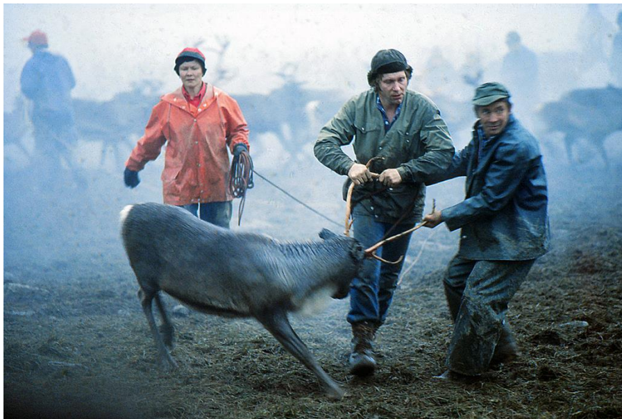
...och med lite hjälp förpassas rentjuren in i den rätta fällan.