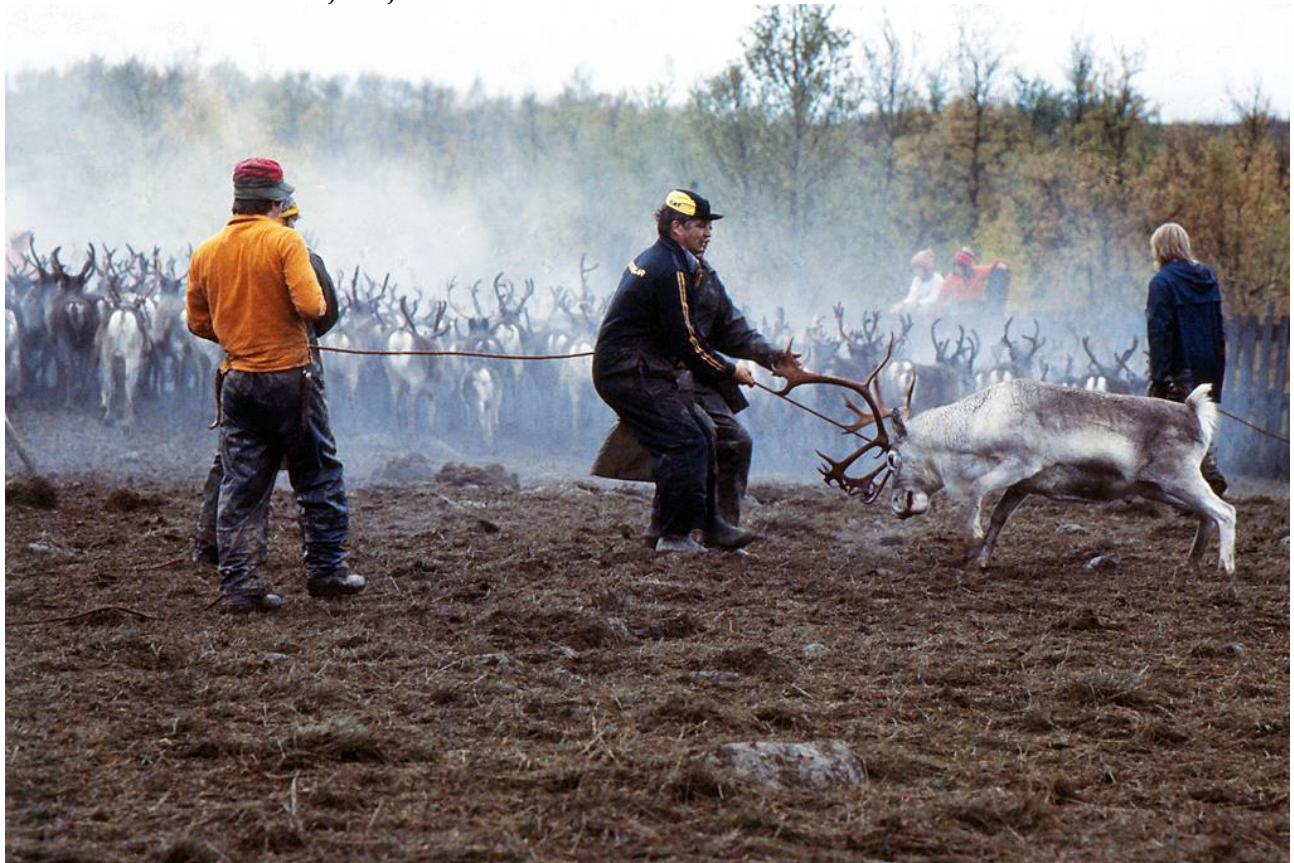
Stilstudie av den uråldriga dragkampen mellan människa och djur.