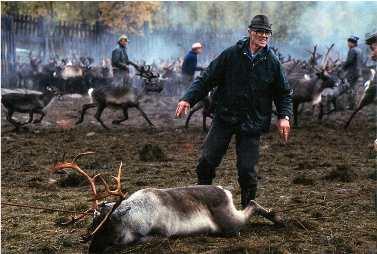
Det krävdes två kasttömmar för att fånga den här ståtliga rentjuren.

Hundratals förväntansfulla ögon kisar genom morgondimman bort mot björkskogen. Och plötsligt är det som om själva marken har fått liv. En böljande, gungande, grå massa växer fram mellan knotiga trädstammar. Och sedan kommer ljudet. Först ett lågmält muller, som åska på avstånd, sedan bölandet, frustandet och det märkliga knäppandet från tiotusentals klövar. Hjorden kommer närmare. En skog av vajande hornkronor växer upp framför oss. Ångan från tusentals varma, svettiga djurkroppar blandas med markens dimma.