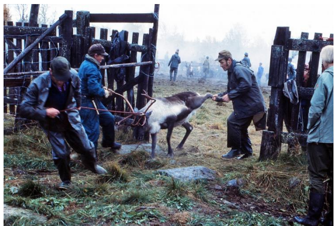
Här behövdes tre man för att få bukt med en stark sarv.