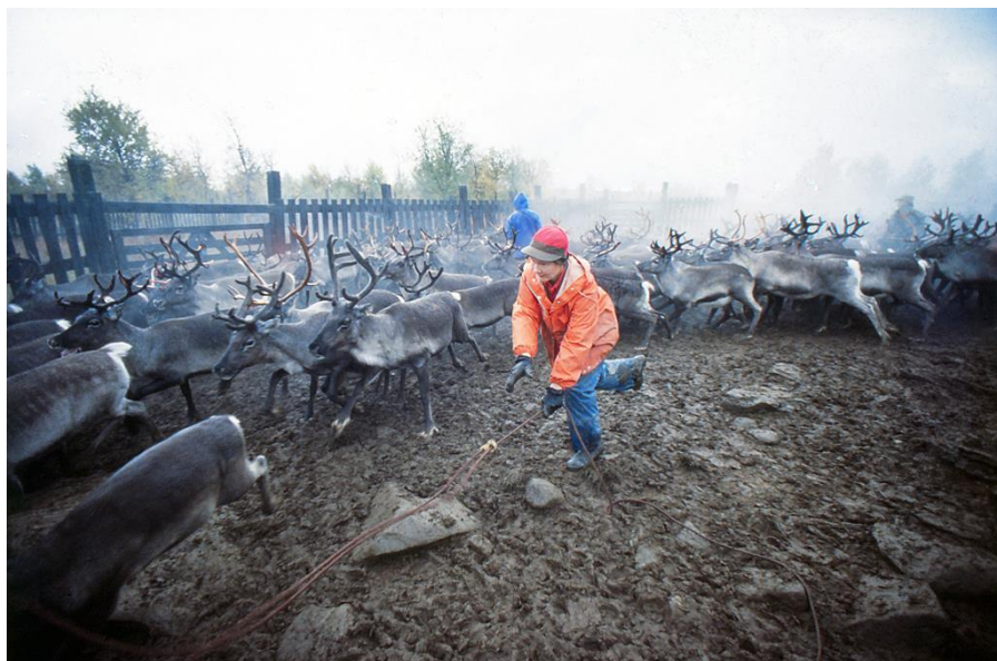
...ett lyckat lassokast – repöglan fastnar i sarvens hornkrona och renen är infångad...