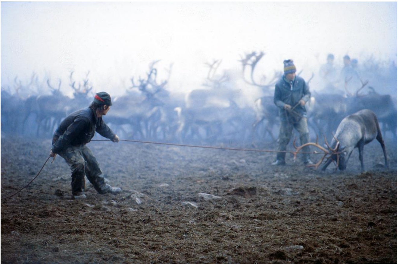
En rentjur har fångats med en mästerligt lassokast och ska nu "bogseras" in i fällan.

Förra året blev det en misslyckad renslakt här vid Kraipe.