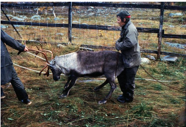
En motsträvig rentjur får hjälp på traven att komma in i fållan..

När den innersta, cirkelrunda rengårdan blivit fylld med renar stängs den trånga ingången med en gisten, grå träport. Ett kort ögonblick tycks renarna tveka. Det lyser av skräck och förvåning ur deras ögon. Men sedan börjar de lugnt löpa runt inne i fållan. Det här ögonblicket är alltid lika fascinerande: att se hur renarna, som på ett givet kommando, anpassar sig och bildar ett böljande kretslopp inne i renhagen. Och det märkligaste av allt – renarna springer alltid åt samma håll! Sedan urminnes tider springer renarna i en instängd renhjord alltid motsols.