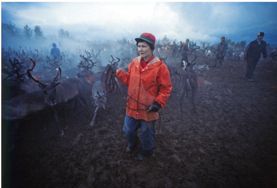
En renägare har fått syn på en rentjur med det rätta öronmärket...

Här och var i den vindpinade björkskogen runt gårdan flammar små kaffeeldar. Ett par rejäla smörgåsar, eller torkat renkött och några muggar hett, starkt kaffe sitter bra så här i sista minuten. Vi är säkert ett hundratal personer, som försiktigt, nästan andäktigt, väntar i den kalla morgonen. De allra flesta är naturligtvis renägande samer, merparten kommer från samebyarna kring Ammarnäs-fjällen, men också från Tärnafjällen i söder och ända uppe från Jäckvik i norr. Renköttsuppköparna från Diknäs och Arvidsjaur finns också på plats, deras stora, moderna slaktbussar är framkörda intill slaktfällan och professionella slaktare med slipade knivar och laddade slaktpistoler står redo. Resten av oss är nyfikna