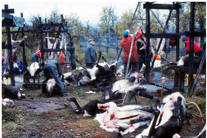
Renslakten kan te sig som ett blodigt och hedniskt skådespel.