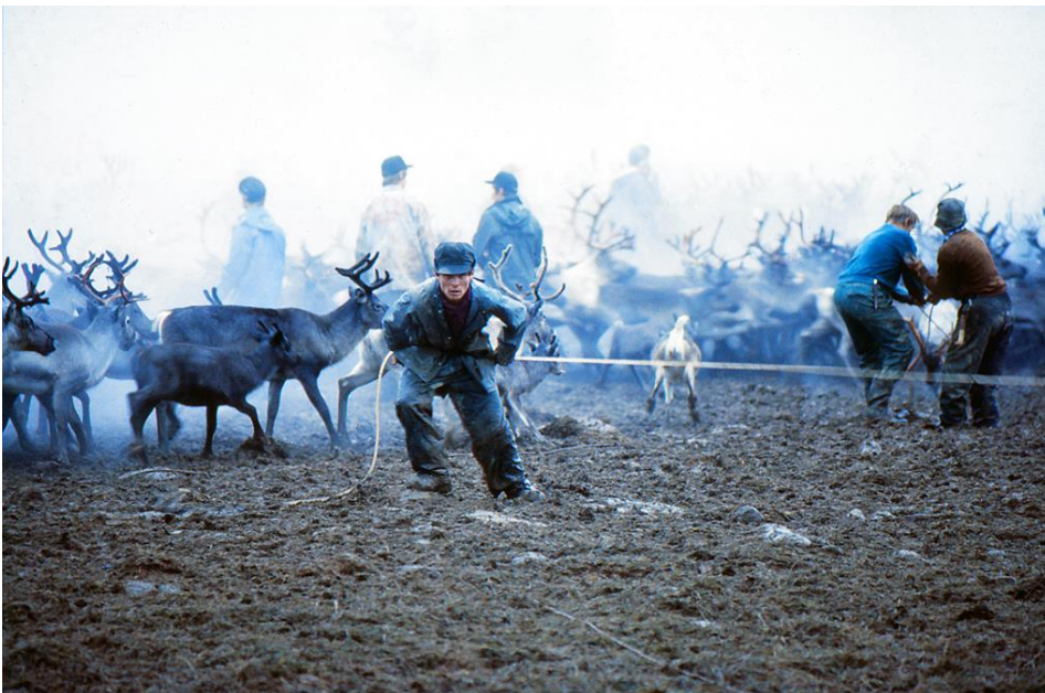
Marken i gärdan blir fort upptrampad och lerig och gör dragkampen med renarna svårare.

Det blev bara ett hundratal renar, som man till sist lyckades driva in i den gamla rengärdan, slakten blev ett fiasko och för många samer uteblev hela årsinkomsten.