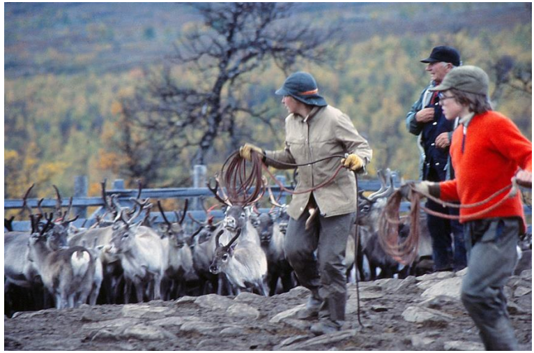
Med kasttömmarna beredda spanar man in i den böljande hjorden.