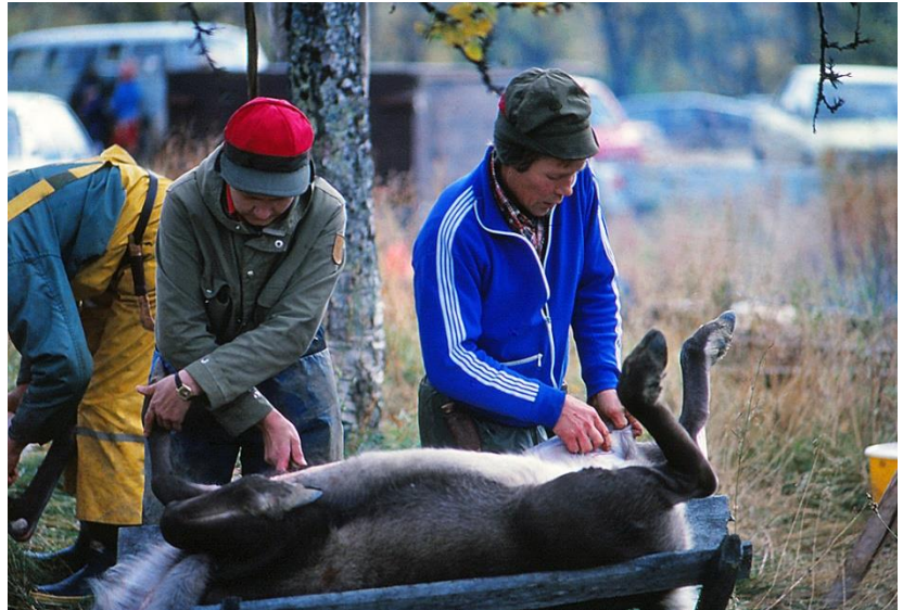
En eller ett par renar slaktas till familjens egna behov.

Ty just så här har det gått till sedan urminnes tider på samernas slaktplatser i de svenska fjällen.