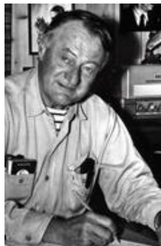
John D. Voelker i sitt hem i Ishpeming, Michigan.