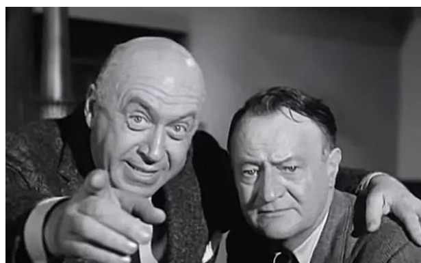
Robert Traver/John D. Voelker (t.h.) tillsammans med regissören Otto Preminger (t.v.) vid inspelningen av Anatomy of a Murder.

Trots framgången i rätten drog John D. Voelker ner på sitt arbetstempo och ägnade allt mer tid åt sitt fiske och sitt skrivande. Inspirerad av den uppmärksammade mordrättegången skrev han 1958 under sitt pseudonym Robert Traver kriminal- och rättegångsromanen "Anatomy of a Murder" som kom att fullständigt förändra hans liv! Romanen, som han skrev på endast tre månader, blev en omedelbar framgång och den blev också inom kort till en framgångsrik långfilm i regi av välkände Otto Preminger och med bl a James Stewart , Lee Remick , Ben Gazzara och George C. Scott i de ledande rollerna. Filmen hade samma namn som boken och den gick upp på svenska biografier 1959 under namnet "Analys av ett mord" .