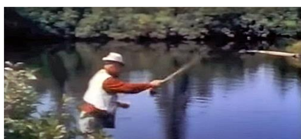
Här finns en liten YouTube-film som skildrar en fiskedag med Robert Traver/John D. Voelker och med honom själv som berättare... Tyvärr lite dålig videokvalitet – men sevärd ändå! (Länk i bilden)